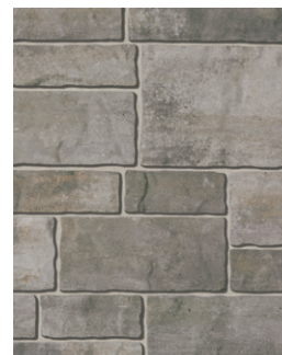
BEIGE DE PALERME